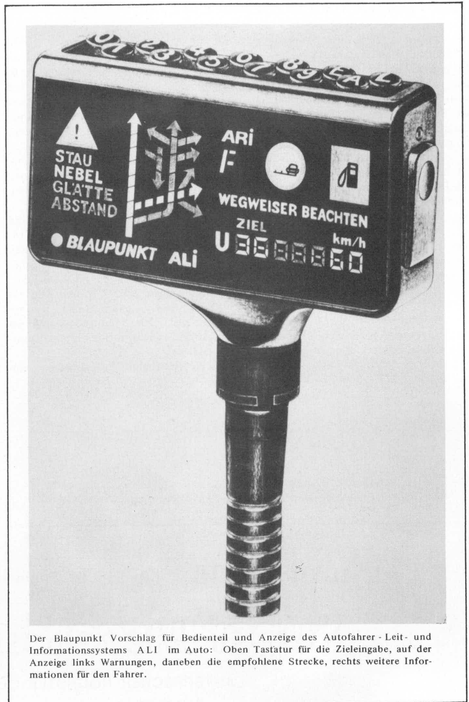
Der Blaupunkt Vorschlag für Bedienteil und Anzeige des Autofahrer-Leit- und Informationssystems ALI im Auto: Oben Tastatur für die Zieleingabe, auf der Anzeige links Warnungen, daneben die empfohlene Strecke, rechts weitere Informationen für den Fahrer.

Auf Anregung des Bundesministeriums für Verkehr (BMV) wurde eine Kosten-/Nutzenanalyse in einem Arbeitskreis aus Vertretern des BMV (Bundesanstalt für Straßenwesen), der TU-München, der TH-Aachen und Blaupunkt