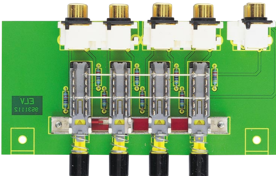
Fertig aufgebaute Leiterplatte des Stereo-Signalquellen-Umschalters mit zugehörigem Bestückungsplan

Tastensatz, 4 x um ..... S1 Cinch - Anschlußplatte, 2polig ..... BU3 Cinch - Anschlußplatte, 4polig ..... BU1, BU2 14 cm Schaltdraht, blank, versilbert 2 Knippingschrauben 2,9 x 6,5mm 3 Knippingschrauben 2,9 x 9,5mm