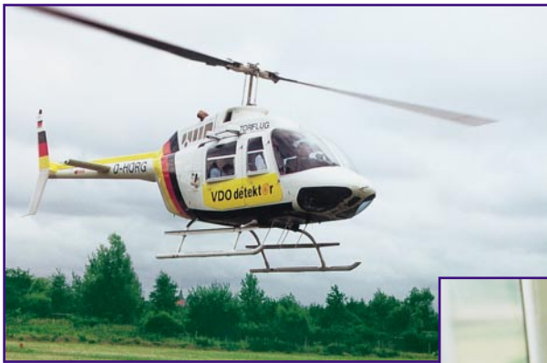
Bild 4: Auch per Hubschrauber kann eine direkte Peilung und Verfolgung realisiert werden. Seine Vorteile: schneller, beweglicher, geländeunabhängig und nicht an Fahrwege gebunden.