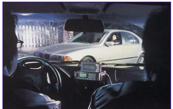
Bild 6: Gefunden - die Nahfeldpeilung führt direkt zum gestohlenen Fahrzeug.

Bleibt abschließend zu erwähnen, daß man eine weitere Einführung auch in anderen Bereichen vorsieht. So könnte denn endlich auch dem unseligen und für die betroffenen Betriebe ruinösen Baumaschinenklau ein Ende bereitet werden. Auch