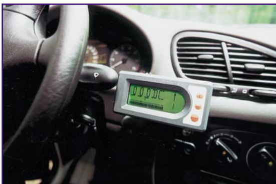
Bild 5: Das Display des Peilgerätes zeigt die Richtung und die Feldstärke an, es erinnert etwas an ein Navigationssystem.

Der Faktor Zeit ist das entscheidende Kriterium bei der Wiederauffindung. Leider setzt sich die ausgeklügelte Logistik erst in Gang, wenn der Besitzer den Diebstahl meldet. Ist dieser z. B. vier Wochen in den USA, rührt sich nichts. Obwohl technisch möglich, wird eine automatische Alarmerung bei Diebstahl bisher nicht realisiert. Vor allem wohl datenschutzrechtliche Gründe verhindern solch ein Vorgehen - denn der Weg zur illegalen und legalen (staatlichen) Nutzung dieser Informationsmöglichkeit über das Bewegungsprofil des Einzelnen ist sehr kurz, wie uns der staatliche Eingriff in die Mobilfunknetze zur