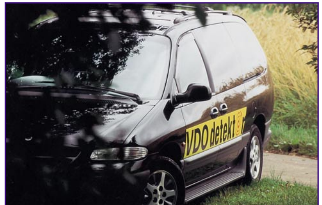
Bild 3: Speziell ausgerüstete Suchfahrzeuge übernehmen die Nahpeilung und Verfolgung.

Technisch funktioniert das Ganze tatsächlich wie das bekannte GSM-Funktelefonsystem. Die Anbieterfirma installiert derzeit eine zum Schluß flächendeckende Infrastruktur aus festen Send-/Empfangsstationen und mobilen Einheiten am Bo-