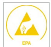
Bild 1: ESD Logo